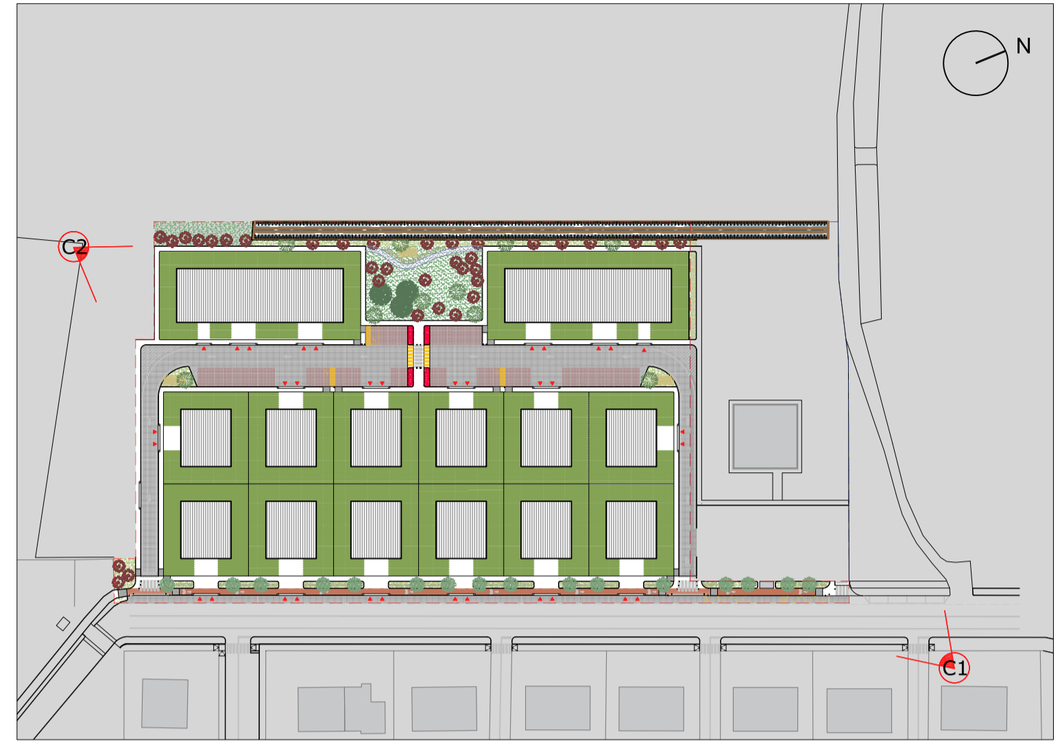
POSIZIONE CAMERE DI PREDI 3D AMBITO DI INTERVENTO P.U.A. - Scala 1:1000