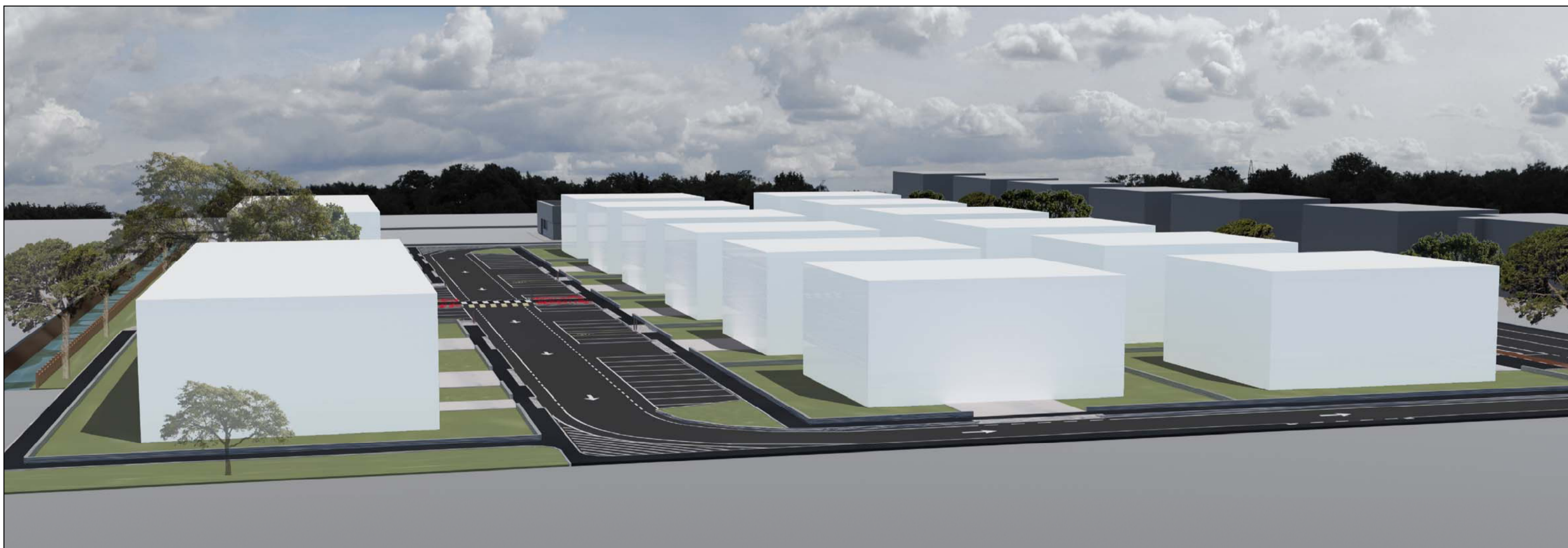
VISTA CAMERA 2 - Posizione Sud - Ovest